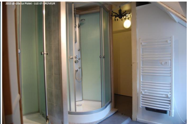
Salle d'eau avec 2 douches et WC