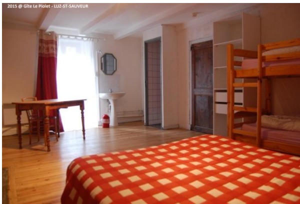
Chambre 4 personnes avec douche, WC et Lavabo