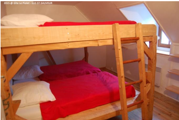
Chambre 4 personnes