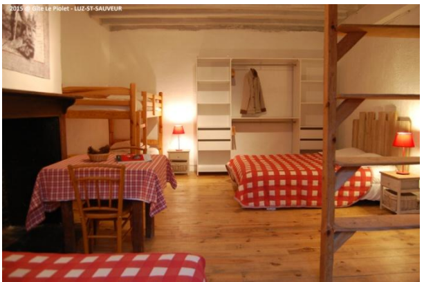
Chambre 4 personnes avec douche, WC et Lavabo