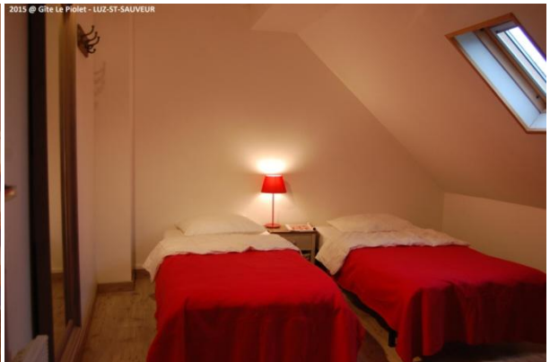
Chambre 2 personnes