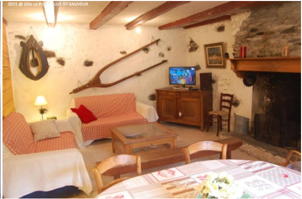
Le Salon avec cheminée