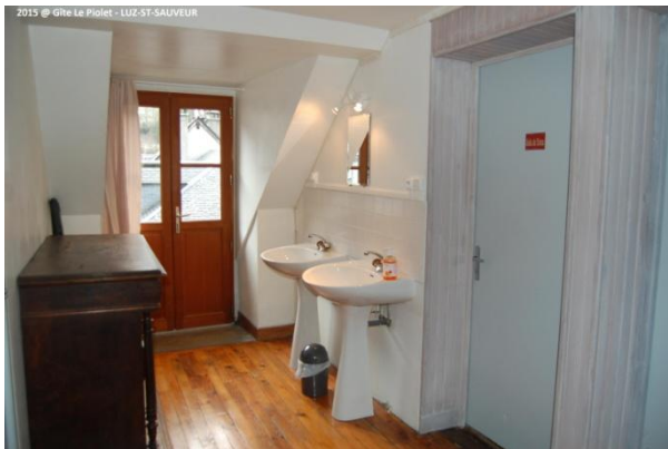
Palier avec lavabos